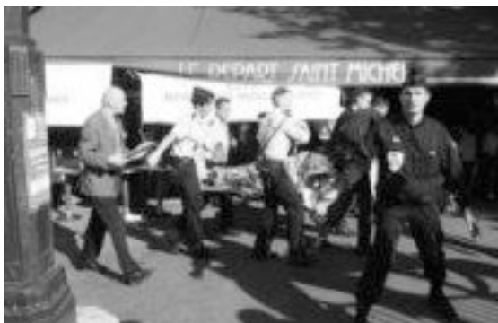
l'attentat du RER à la Station Saint-Michel en juillet 95

Prise dans sa folie meurtrière, l'Algérie se retrouve alors coupée du monde. Les lignes aériennes étrangères se desservent plus le pays. La frontière avec le Maroc est fermée. Les agences de presse internationales et les correspondants étrangers sont partis. Sur place, les journalistes autochtones doivent redouter les terroristes, mais aussi le gouvernement qui interdit toute information sur le terrorisme qui n'aurait pas son aval et qui ferme les journaux d'opposition.