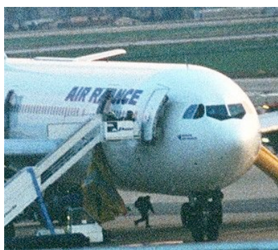
Sur le tarmac de Marignane, le GIGN à l'assaut de l'Airbus détourné par un commando du GIA en décembre 1994

Il s'agit aussi de porter les attaques sur le sol français. En décembre 1994, une tentative de détournement d'un vol Air France Paris-Alger, qui a échoué, s'est terminée sur le tarmac de Marseille-Marignane. Mais il y aura plusieurs attentats à la bombe au cours de l'année 1995, notamment dans le RER le 25 juillet 1995 (8 morts et 150 blessés) et dans le métro les 6 et 17 octobre 1995 (Cf. le récent procès de Rachid Ramda)