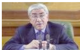
Le président Zéroual annonce lors d'une allocution télévisée, son intention de démissionner

De son côté, le GIA est de plus en plus miné par les dissensions internes. La plus grave se produit en septembre 1998 avec la scission du Groupe salafiste pour la prédication et le combat (GSPC)