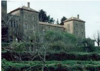
Le monastère de Tibhirine, près de Médéa

Autre cible privilégiée : les étrangers non musulmans encore dans le pays, qui, s'ils ne quittent pas le pays, vont être systématiquement assassinés à partir de septembre 93 (meurtres qui atteindront leur point culminant au printemps 96 avec l'enlèvement puis l'exécution des moines trappistes de Tibhirine)