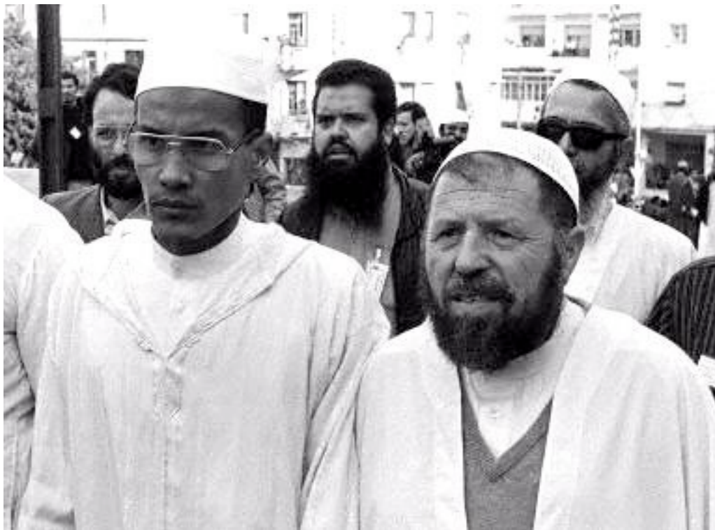
Madani et Belhadj, dirigeants du FIS

Le FIS devient rapidement un parti important, avec un énorme électorat, essentiellement concentré dans les zones urbaines. En 1990, il remporte largement les élections locales (953 communes sur 1539 et 32 wilayas sur 43). La première guerre du Golfe renforce encore son influence.