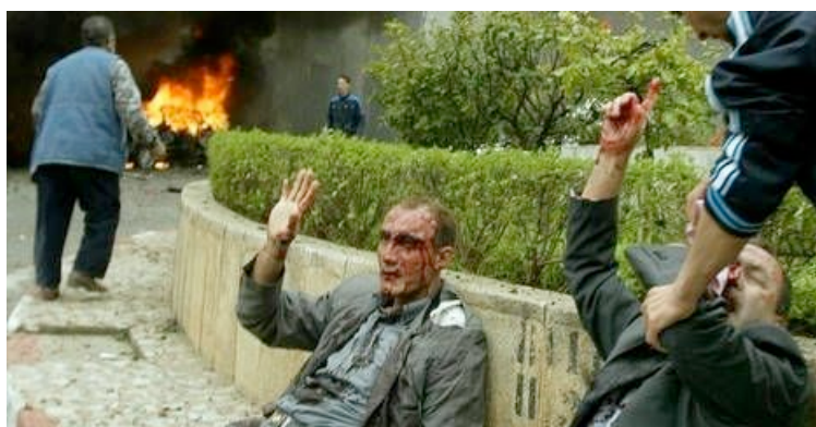
Attentats d'Alger, avril 2007

La violence diminue alors sensiblement, pour disparaître presque totalement après 2002. La remise en liberté des leaders du FIS (Madani et Belhadj) ne change pas la donne. Bouteflika est réélu en 2004 avec 84% des voix. Un an plus tard, il fait voter par référendum une deuxième amnistie. Cette « loi de réconciliation nationale » suspend toute poursuite à l'encontre de toute personne n'ayant plus d'activité combattante et indemnise toutes les familles dont un membre a été tué par les forces gouvernementales. Malgré ce, quelques groupes armés n'ont pas totalement rendu les armes. Notamment le Groupe salafiste pour la prédication et le combat, rebaptisé Al Qaïda pour le Maghreb islamique, qui, en avril 2007, a revendiqué les deux attentats kamikazes contre le Palais du gouvernement d'Alger qui ont fait 33 morts et plusieurs centaines de blessés.