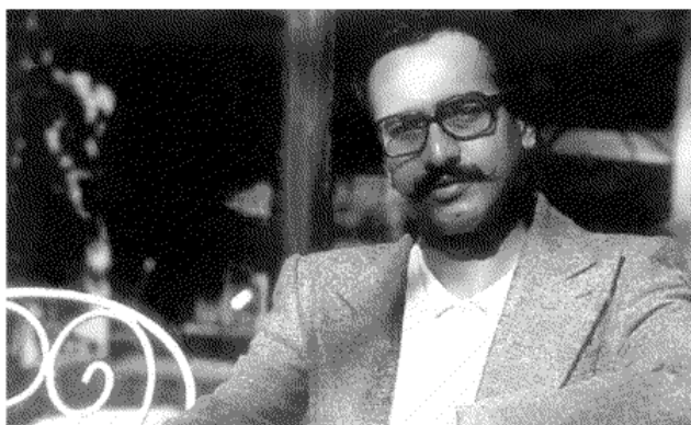
L'écrivain et journaliste Tahar Djaout, qui fut le premier de la « liste noire » à être exécuté.