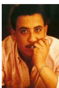
Abdelkader Alloula, Matoub Lounes et Cheb Hasni

Toujours en mai 1993, le GIA décide d'étendre sa liste noire aux journalistes algériens et étrangers qui ne lui sont pas favorables, proclamant partout : « Quiconque se bat par la plume périra par l'épée ».