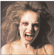
[3 = 7 - colère]

La paresse désigne un état d'apathie, la lassitude du moine, l'inquiétude du cénobite face à l'apparente inutilité de sa vocation. Elle est donc d'abord un vice monastique. Cassien lie l'acédie à la tristesse qui empêche toute contemplation. Ce vice offre de multiples rejets : l'oisiveté, la somnolence, l'inquiétude, le vagabondage de l'esprit, la verbosité et la curiosité. L'instrument de lutte contre ce vice est donc le travail manuel. Vice instable, absorbé par la tristesse dans les réflexions théologiques, elle apparaît vite comme obsolète pour Grégoire le Grand, mais les écrits monastiques perpétuent sa présence comme « rébellion du corps aux contraintes auxquelles il est soumis à l'intérieur du monastère » (Pierre Damien). Faiblesse du corps pour les uns, elle est faiblesse de l'esprit pour d'autres comme Bernard de Clairvaux et Adam Scot qui la comprennent