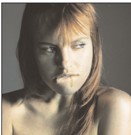
[3 = 7 - envie]