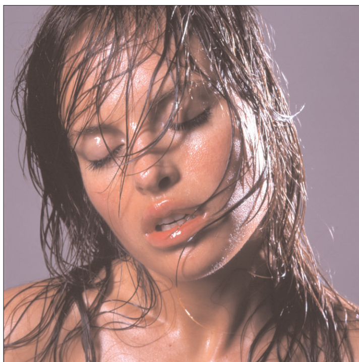
[3 = 7 - luxure]

espace culture du 21 avril au 03 mai 2004