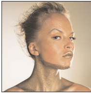
[3 = 7 - orgueil]

L'orgueil est le commencement de tout péché, et pour les théologiens médiévaux, "le péché général qui [résume] en lui toutes les fautes". Ce vice est décliné en vaine-gloire (la gloire terrestre, à laquelle elle a longtemps été identifiée) et en superbe, selon Augustin, Grégoire le Grand et Bernard de Clairvaux. Thomas d'Aquin rompt avec ce système en modelant un orgueil différent pour chacun qui "correctement régulé par la raison (...) se traduit par une attitude vertueuse (...) : la magnanimité". Se développe alors une compétition entre magnanimité et humilité dans la lutte pour la vertu la plus efficace dans le combat contre le vice. Le passage sémantique entre vaine-gloire et vanité est le fruit de la lecture de Grégoire le Grand. D'abord considéré comme un vice des gens de culture (Abélard), il est étendu à la culture de l'apparence condamnée chez les clercs et surtout chez les femmes (prédications terribles de Bernardin de Sienne contre les parures en 1424). La vanité est assimilée à la coupable volonté de séduire par-delà les dons de la nature, elle est "outrage envers Dieu", donc danger familial et social. Jérôme Savonarole clôt cette extension sociale du vice : l'acte de "qui dépasse les rangs de son statut est vanité", ouvrant les bûchers qui lui sont liés.