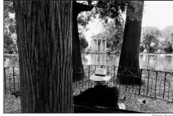
En donnant du grain aux pigeons entre les troncs des séquoïas le flâneur dédie à Vénus le petit temple funéraire

Serge Assier, par choix professionnel sans doute, mais également en vertu d'un style de vie qui lui est propre, accorde sa préférence à une photographie d'extérieur faite d'instantanés qui entrecroisent tout à la fois le tissu urbain et les récits de vie, les pauses d'intimité et la chronique des événements, les petites et les grandes histoires, les personnes et les personnages. Le développement et la matérialisation de ce « théâtre de vie » trouve dans ses images un espace scénique privilégié.